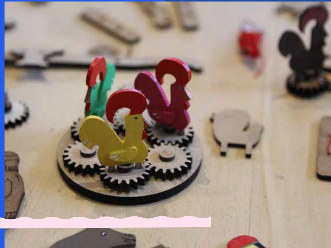
Jouetage - Lucio Araujo Résidence 2018