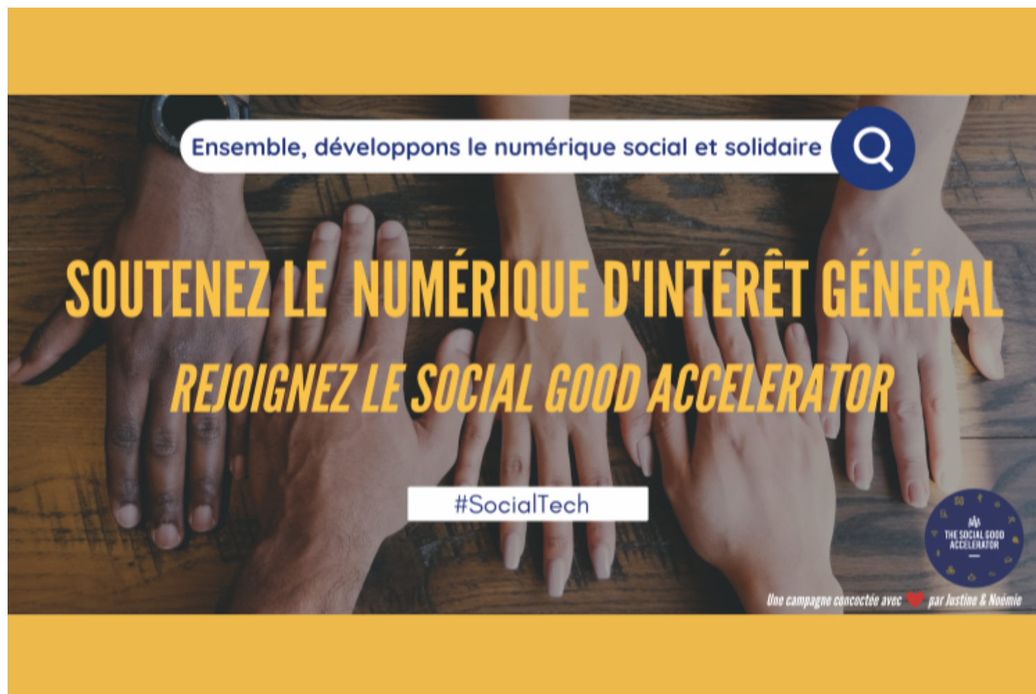
Soutenir le numérique social et solidaire, le trou dans la raquette qu'il faut combler avant 2030

À l'occasion du #GivingTuesday en France, le Social Good Accelerator – think et do tank de l'économie sociale numérique – lance sa campagne de collecte et d'adhésion. Pour développer par le biais des coopérations un modèle numérique européen solidaire, durable et accessible à toutes grâce aux modèles de l'économie sociale. L'économie sociale et solidaire représente 10 % du PIB, la moitié générée par nos 1,5 million d'associations, 5 000 fondations et fonds de dotation actifs à l'aide de 12,5 millions de bénévoles et près de 2 millions de salariés.